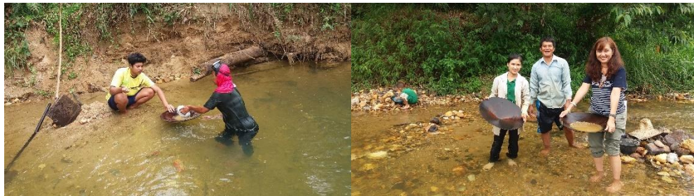
ภาพที่ 6 ชาวบ้านกำลังร่อนทองในสายธาร ที่มา: ถ่ายโดยคณะผู้วิจัย วันที่ 15 กรกฎาคม 2560