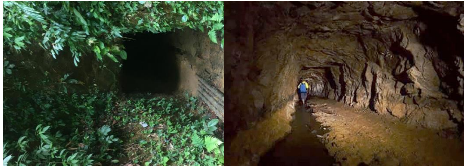
ภาพที่ 3 ปากทางเข้าเหมืองแร่ทองคำโต๊ะโมะกลายเป็นแหล่งท่องเที่ยวทางประวัติศาสตร์