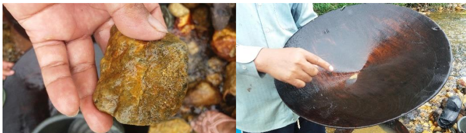
ภาพที่ 7 สายแร่ทองคำที่ติดอยู่กับหิน และร่อนทองจนกระทั่งได้ทองในเลี้ยง วันที่ 24 พฤษภาคม 2560