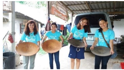
ภาพที่ 4 การร่อนทอง และเลี้ยงหรืองานที่ใช้ร่อนทอง